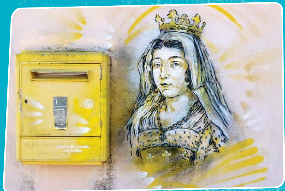
QUELQUES EXEMPLES D'ŒUVRES DE C215 QUE VOUS RENCONTREZ LORS DE VOTRE PÉRIPLÉ...